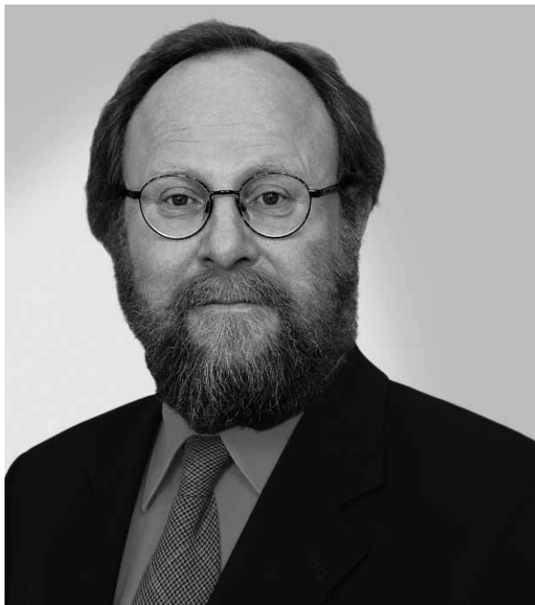
Dr. h.c. Wolfgang Thierse

„Kinderrechte sind Menschenrechte“ – das ist das Motto der National Coalition (NC) in Deutschland