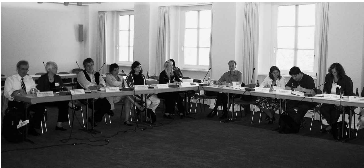
Teilnehmerinnen und Teilnehmer des Kinderkoalitionsgesprächs